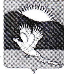
Рис С.Ю. Улитин